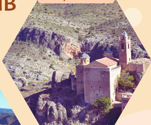
RECINTO AMURALLADO Ruta patrimonial