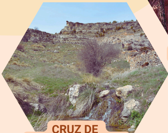
CRUZ DE LOS TRES REINOS Paraje Natural Municipal